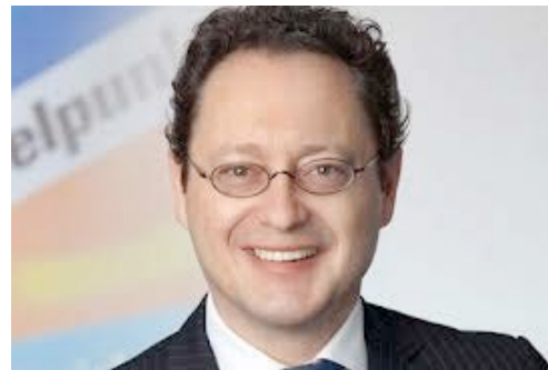
Chief Information Officer